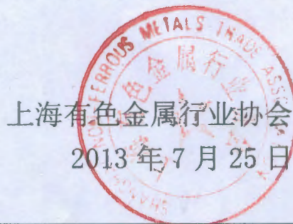
回 执 表